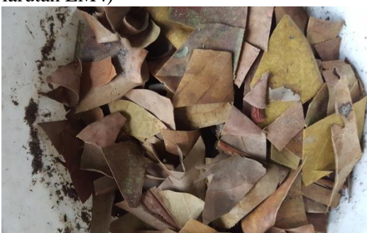
Gambar 5 proses pencampuran media

3.Menaruh cacahan di wadah dan mencampur dengan media lain (tanah dan larutan EM4)