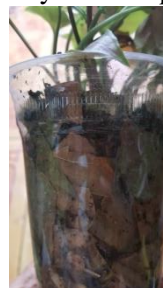
Gambar 4 recycling sampah olahan daun kering sebagai media tanam dan pupuk kompos.

Dengan pengelolaan sampah dari daun kering tersebut diharapkan dapat menjadi input yang berguna yang dapat menjadi upaya dalam pengurangan sampah dan terjadinya polusi seperti pembakaran sampah yang menyebabkan polusi udara.