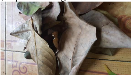
Gambar 3 Daun daun kering

1.Menyiapkan material yang digunakan (sampah daun kering)