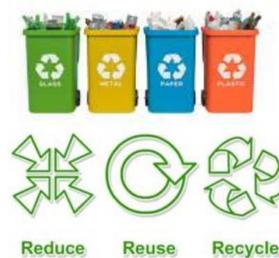
Gambar 1 Siklus 3R