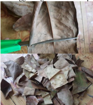
Gambar 4 Proses pencacahan Sumber : penulis ,2022

3.Menaruh cacahan di wadah dan mencampur dengan media lain (tanah dan larutan EM4)